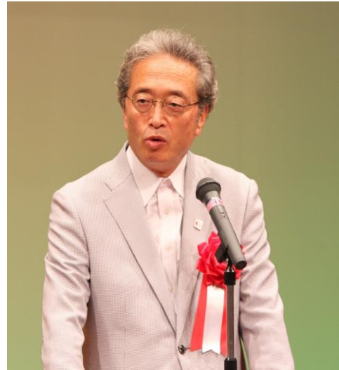
竹田市長 首藤 勝次 様