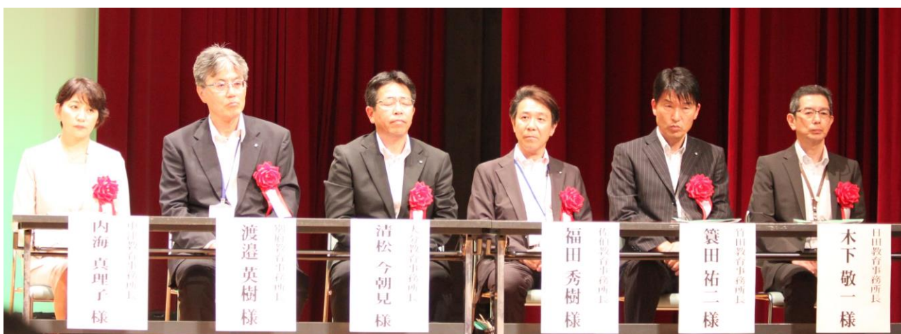
【指導・講評をいただいた各教育事務所長様】