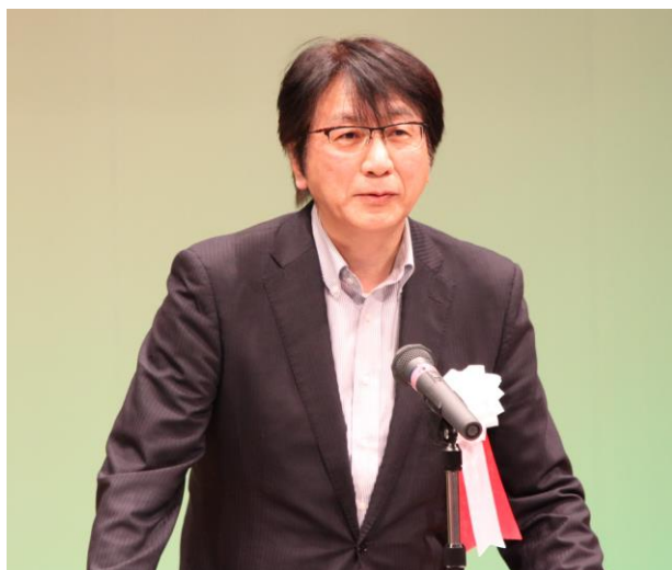
【次年度開催地代表あいさつ】