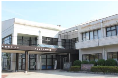
くじゅうサンホール（久住公民館）