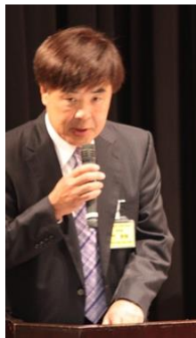
進行：光門大会事務局長