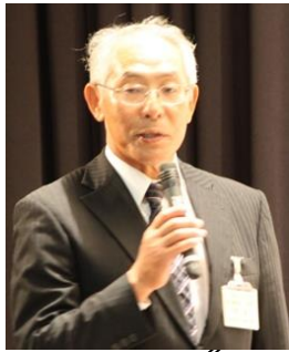
矢野大会実行副委員長