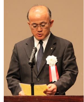
堤大会運営研究副部長