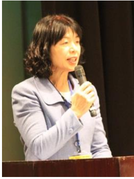
坂本大会実行委員（総務部）